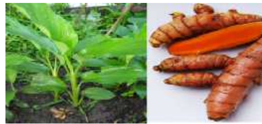
Gambar 2. Tanaman kunyit (kiri) dan rimpang kunyit (kanan) 12

Genus : Curcuma Spesies : Curcuma domestica