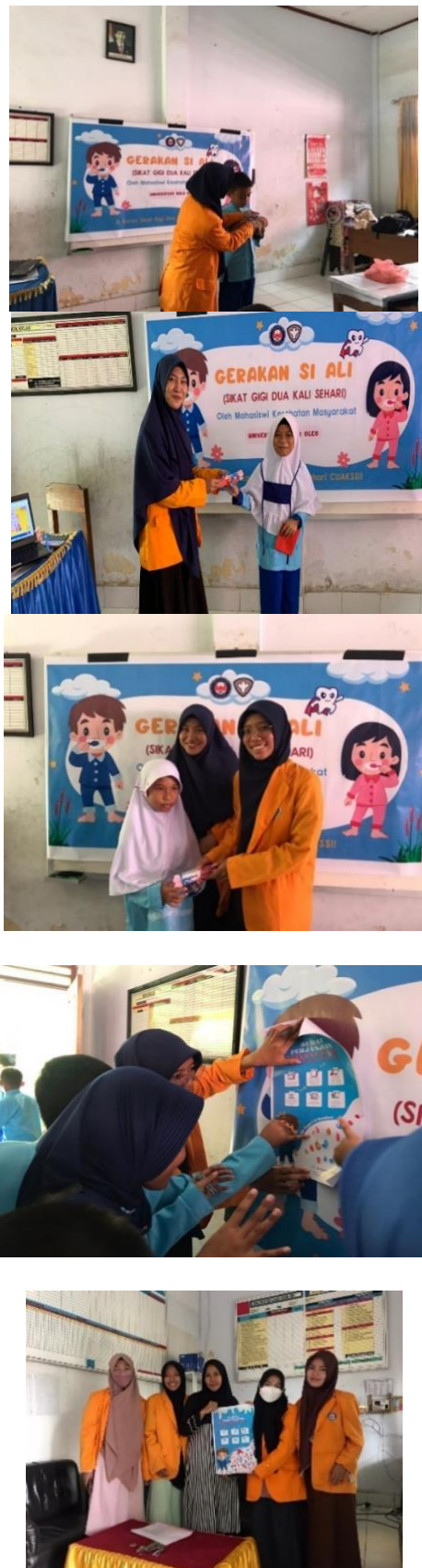
Gambar 6, 7 dan. Kegiatan melakukan sosialisasi kepada SD Negeri 51 Kendari.