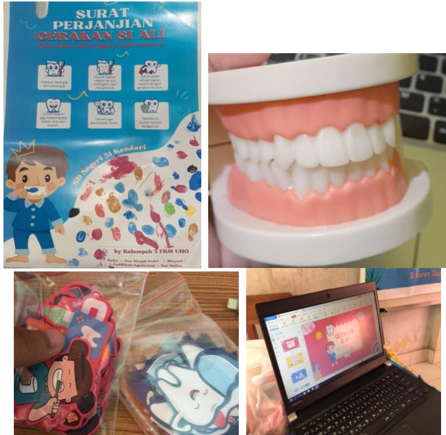
Gambar 2, 3, 4, 5. Media yang di gunakan pada edukasi terhadap anak-anak SDN 51 Kendari.