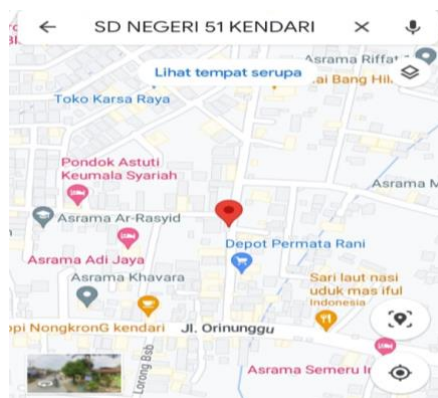
Gambar 1. Peta SD Negeri 51 Kendari Kecamatan Kambu.

Media persentase dengan Microsoft PowerPoint membantu meningkatkan pengetahuan kepada siswa-siswi dengan pemaparan materi secara lengkap dan detail, disertai gambar dan warna persentase yang disusun sesuai kebutuhan edukasi. Media stiker merupakan media membantu menarik motivasi siswa dengan karakter dan gambar gigi sehat, bisa ditempel pada buku dan tempat-tempat yang sering mereka akses untuk mengingatkan sikat gigi sesuai standar yang benar.